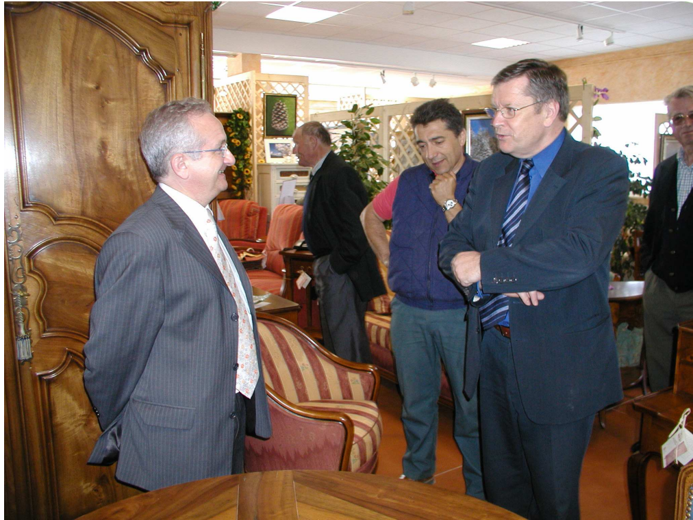
Joël MERCIER, Sous-Préfet de Saint-Flour en visite à Pierrefort le 8 juin 2005

Cela s'ajoute aux nombreuses actions menées en faveur du tourisme : guide d'accueil, film promotionnel, dépliants d'appel, topo-guide, site internet..., aux non moins nombreuses activités proposées par les permanents (activités sportives, visites de ferme, accueil de cars...) et aux multiples manifestations organisées par les associations et qui offrent une belle attractivité à notre pays.