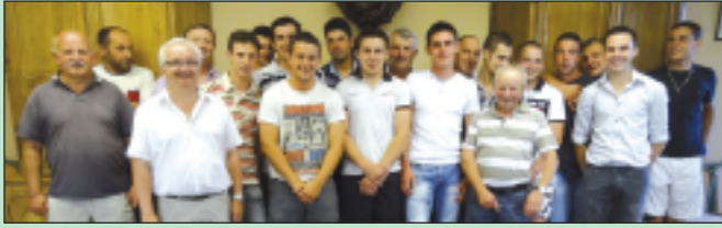
L'équipe a été accueillie en Mairie et félicitée par les élus pour son accession en Promotion d'Honneur

Souhaitons bonne chance à toutes les équipes de l'ESP pour cette saison 2013/2014.