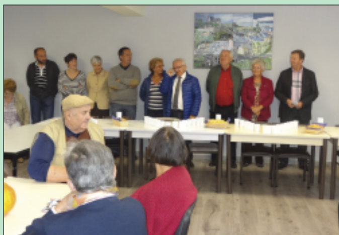
Inauguration en présence de plus de 60 personnes

Une belle réalisation livrée au Montrozier Club dans l'été, qui retrouve un lieu de rencontre convivial, accueillant et adapté à tous.