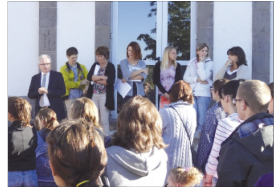
Une rentrée scolaire sous le signe du changement et sous le soleil.

Comme toute nouveauté, ces activités périscolaires ont besoin de temps pour se mettre en place, pour trouver des solutions aux petits problèmes qui ne manquent pas de se poser. Soyons donc patients, afin de pouvoir aboutir à une organisation bien rodée, où chacun trouvera son équilibre.