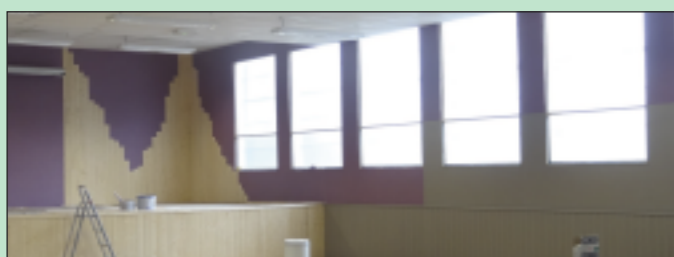
Le nouvel habillage de la scène

L'ensemble des travaux réalisés est estimé à 90.000€ (sans compter le temps de travail des agents techniques).