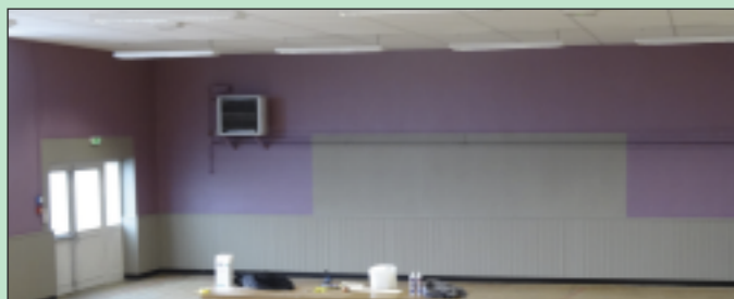
De nouvelles couleurs pour une salle rénovée

Après une longue période de travaux, le gymnase du collège devient la salle récréative, qui peut accueillir bals, quines, manifestations diverses... D'importants travaux de mise aux normes ont été menés sur l'électricité, l'isolation, la plomberie et les sanitaires, ainsi que les issues de secours. Un coin bar a été aménagé, équipé de réfrigérateurs et congélateurs. Les revêtements muraux ont aussi été revus : lambris et peinture ont occupé les agents techniques pendant de nombreuses heures. Certains travaux de peinture restent encore à réaliser, dans les périodes où la salle n'est pas utilisée.