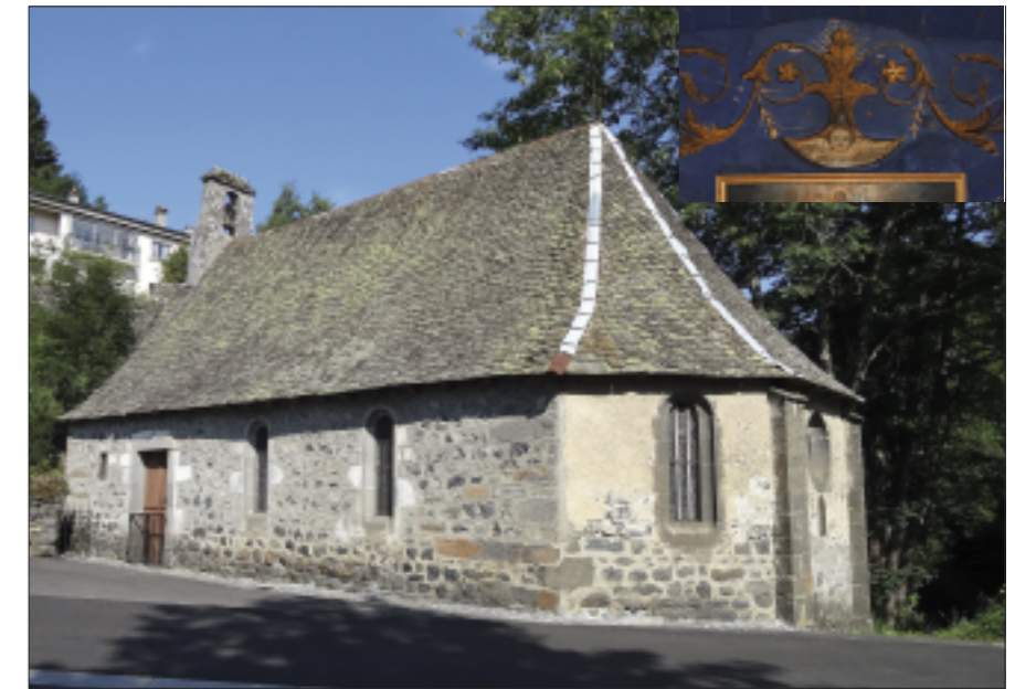
L'extérieur et l'intérieur de la chapelle de Planchis ont besoin d'être rénovés.

Cette réhabilitation s'intègre dans un programme de création d'un sentier de découverte du patrimoine bâti du bourg de Pierrefort. L'ensemble de l'opération a été confiée à la Communauté de Communes du Pays de Pierrefort-Neuvéglise dans le cadre d'une opération sous mandat. Les subventions escomptées sont de l'ordre de 44.000€, auxquels il faudra ajouter la subvention de la Fondation du Patrimoine. En effet, l'organisme soutient la restauration de la chapelle de Planchis en plus des souscriptions recueillies.