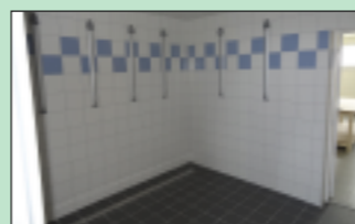
Salle de douche

Précisons qu'un filet pare-balls supplémentaire va être installé pour protéger la façade du bâtiment des tirs intempestifs.