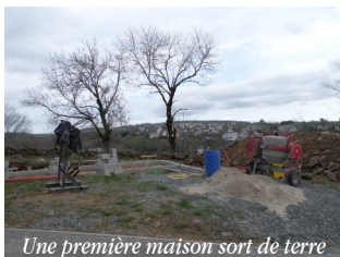
Une première maison sort de terre

Six lots sont désormais vendus et quatre permis de construire ont été déposés : trois ont été accordés et un est en cours d'instruction.