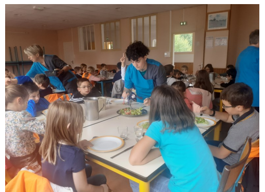
Des aménagements pour l'école