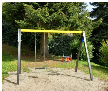
Nouveaux jeux pour le jardin public