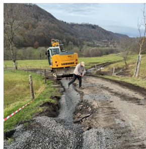
Réfection des chemins ruraux et de celui d'Isergues