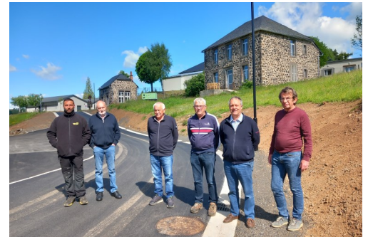
Ouverture de la Maison de Santé Pluridisciplinaire