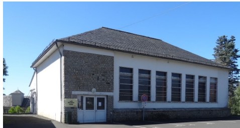
Isolation de différentes salles