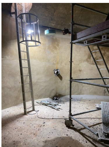
Réhabilitation des réservoirs