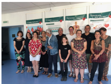
Exposition proposée par l'association de Saint-Flour et accueillie par l'asso- ciation locale